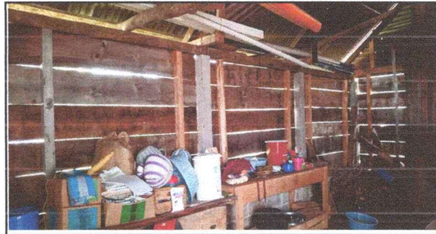
Foto 6: Otra vista del interior de cocina a cambiar y habilitación de ventanas

Observación: Si es necesario se pueden agregar hojas adicionales y actualizar el número de hojas.