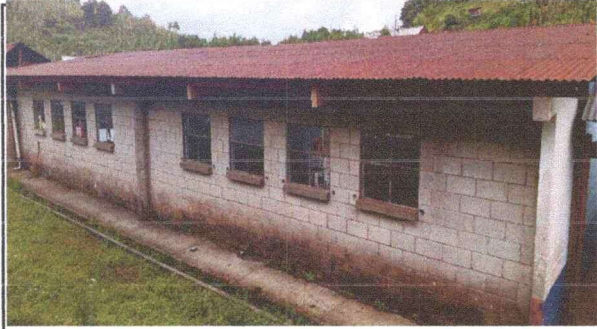
Foto 1: Vista del establecimiento donde se observa el mal estado en que se encuentra el entechado.