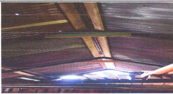
Foto 5: Sustitución de costeneras de madera a costeneras de metal