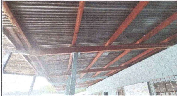
Foto 2: Mantenimiento a estructura metálica (lijado y aplicación de pintura)